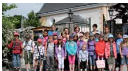
Volksschule Pernitz im Museum