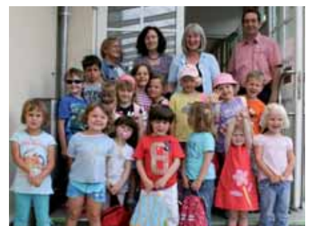
Kindergarten im Museum