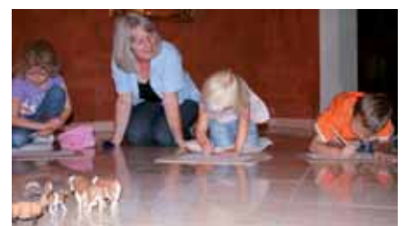
Kindergarten im Museum