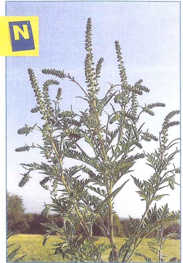
Ambrosia artemisiifolia – Beifußblättriges Traubenkraut